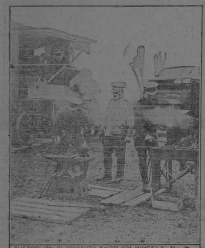
AUSTRALIAN BLACKSMITH SHOP ON WHEELS

Tanto Australia como el Canadá han enviado su valioso contingente para auxiliar la buena causa de los aliados. Estas posiciones inglesas han enviado a los campos de operaciones muchos miles de soldados, muchos centenares de cañones y muchas toneladas de municiones. Ellos han contribuido con numerosos reemplazos para el nuevo ejército inglés de 1,500,000 hombres que actualmente está organizando el General Kitchener. Este gran